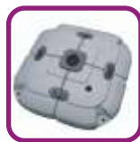
Base rellenable (70 l. máximo)