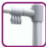
Anillas para bandera