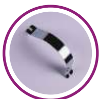
Fleje de presión para foam 5 mm.