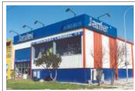
VISTA FACHADA COMPLETA

Letras corpóreas acero inoxidable soldado y pulido