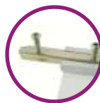
Conector para murales