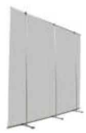
Banner Sprint 100 (mural 3 banners)