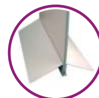
Base aluminio alta estabilidad