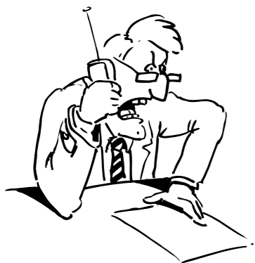
La de los demás...

“ Cuál es la forma más fácil de supervisar un proyecto de imagen? ”