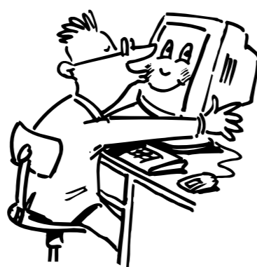
...o la nuestra?